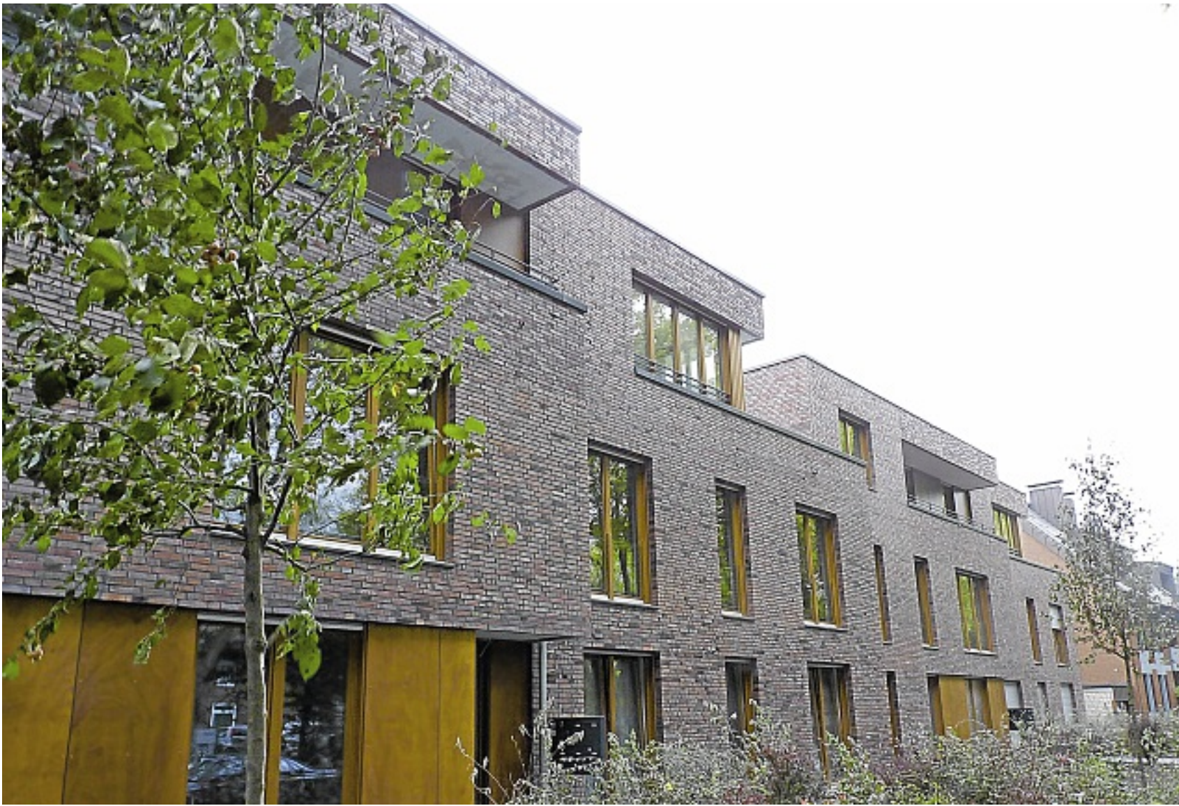
Durch Torfbrandklinker aus dem Emsland erhält die neue Wohnanlage an der Piusallee 84-86 ihre besondere Farbgebung. Sie verleiht dem Gebäude ein unaufdringliches, der grünen Umgebung angepasstes Äußeres.