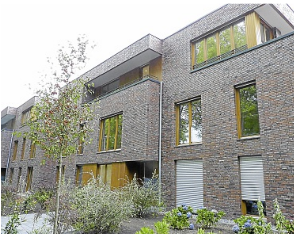
Hochwertige Holzfenster tragen zum elegant-schlichten Look des Neubaus bei. Die moderne Wohnanlage bietet zehn großzügige, komplett barrierefreie Wohnungen.

zer können so alle Vorzüge der Stadt mit ihren Kulturangeboten und Ausflugsmöglichkeiten mit komfortablem Wohnen im Grünen verbinden.